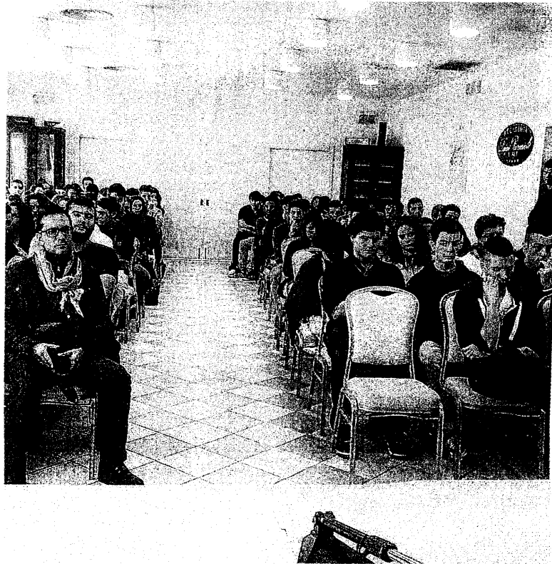
PREMIATI Studenti del «Vasari» nel corso di una premiazione dopo alcuni stage di studio svolti in Inghilterra

IL PROBLEMA maggiore, quello che occorrerebbe risolvere quanto prima, è comunque quello delle infiltrazioni che ogni volta che piove si segnalano qua e là nei vari locali dell'istituto con il rischio che, come peraltro è già accaduto qualche tempo fa, possa crollare anche l'intelaiatura del controsoffitto mentre ci sono gli studenti a lezione con tutte le conseguenze che un fatto del genere comporta. E' già successo e giustamente si vuole evitare che si ripeta. Una delle cause del problema potrebbe derivare dal fatto che il sottosuolo del "Vasari" è completamente vuoto, mentre una buona porzione dei cinquemila metri di superficie potrebbe essere sfrut-